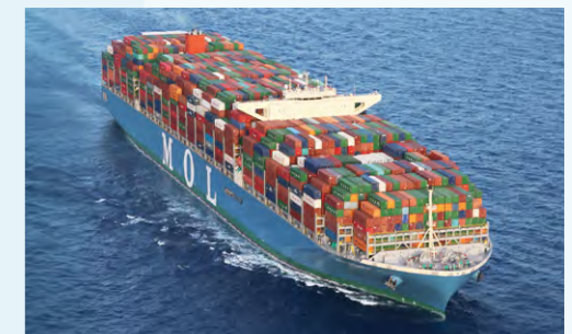
世界最大級の20,000TEU型コンテナ船「MOL TRIUMPH」

グローバルなネットワークと競争力を強化するため、日本郵船、川崎汽船とともに、3社のコンテナ船事業統合を決定しました。統合後の運航規模は約143万TEU、世界シェアは7%と業界第6位の規模となります。「Ocean Network Express」の名称のもと、2018年4月の営業開始を目指し統合準備を進めており、順調に進捗しています。