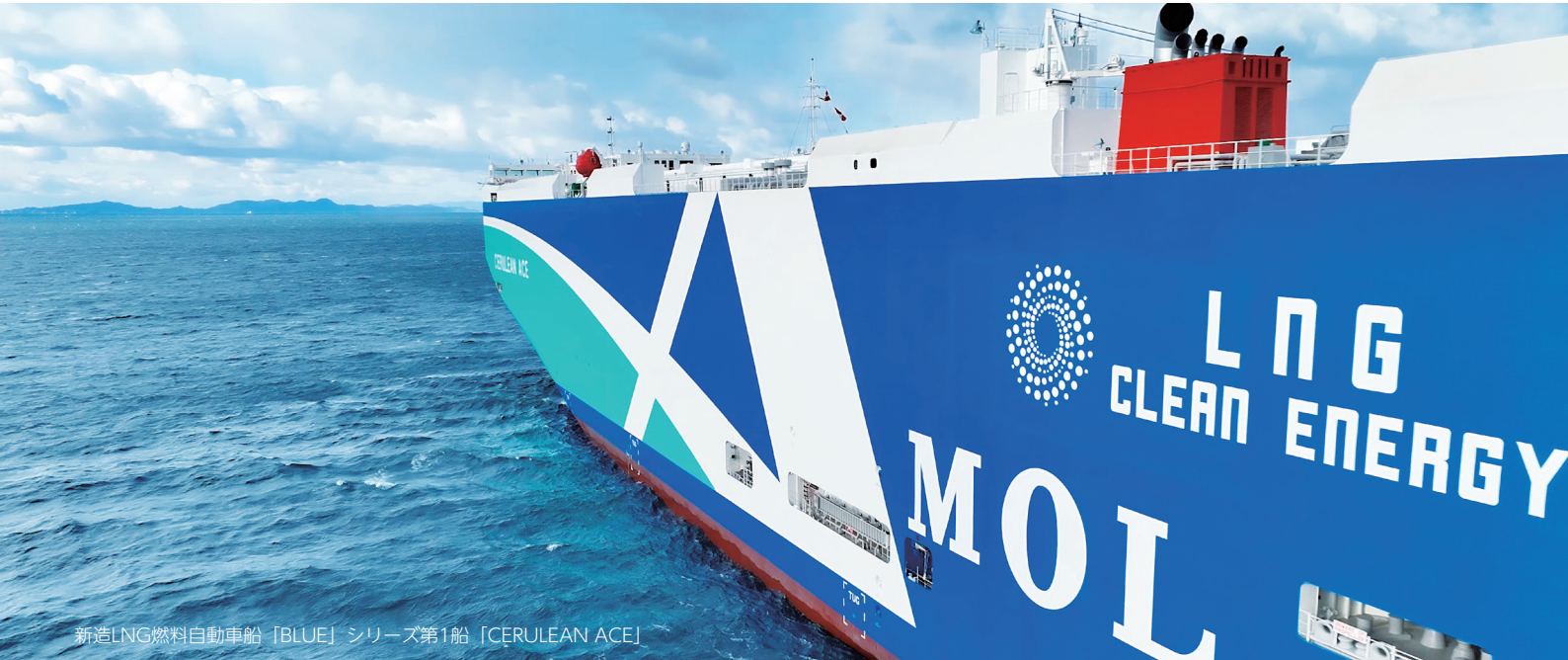
新造LNG燃料自動車船「BLUE」シリーズ第1船「CERULEAN ACE」