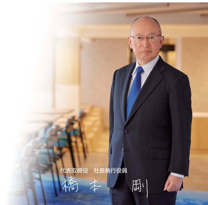
代表取締役 社長執行役員